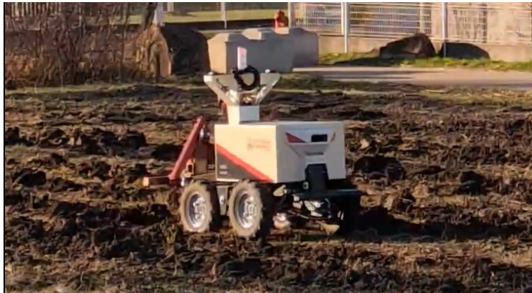
Figure 1.1: Photo de présentation de la mission