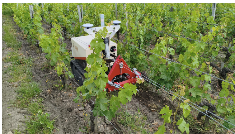
Wykres 1.1: Zdjęcie prezentacyjne misji