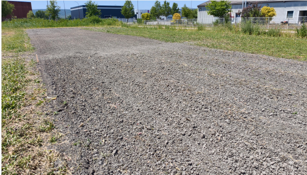
Voor het werk