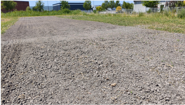
Voor het werk