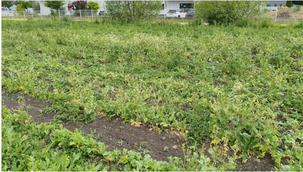
Voor het werk