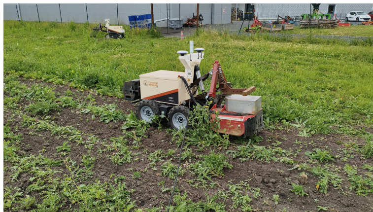
Figuur 1.1: Presentatiefoto van de missie