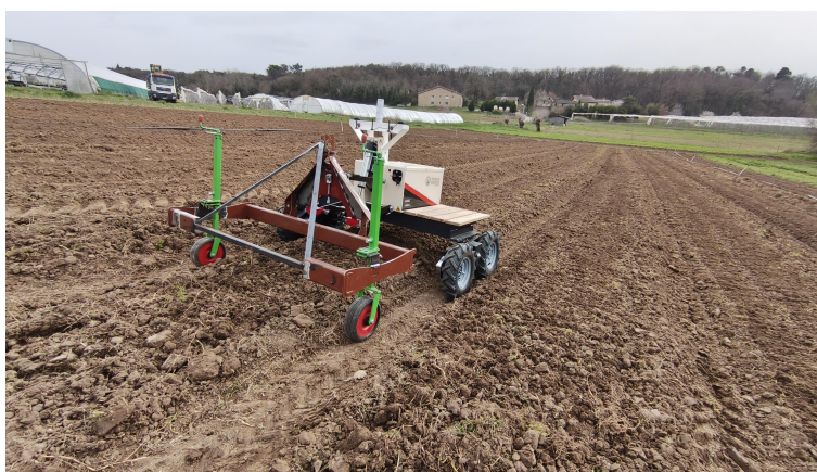
Figuur 1.1: Presentatiefoto van de missie