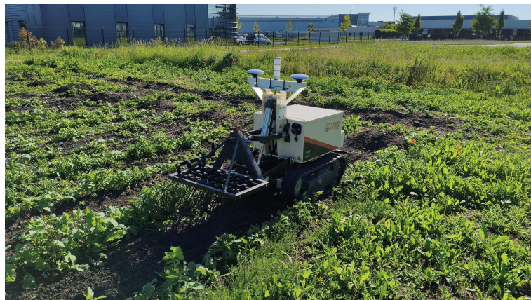
Figuur 1.1: Presentatiefoto van de missie