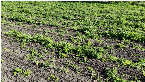
Voor het werk