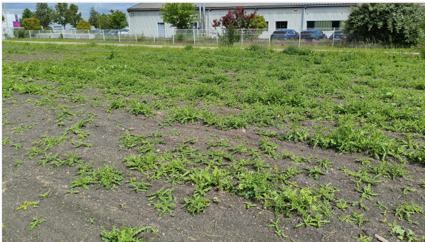
Voor het werk