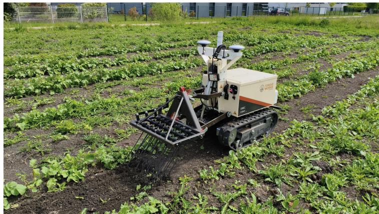
Figuur 1.1: Presentatiefoto van de missie