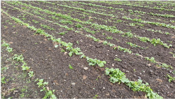
Voor het werk