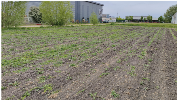
Voor het werk