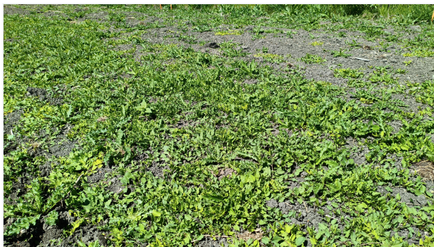
Voor het werk