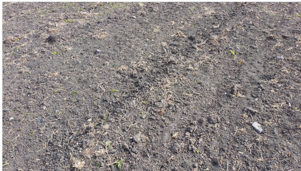
Voor het werk