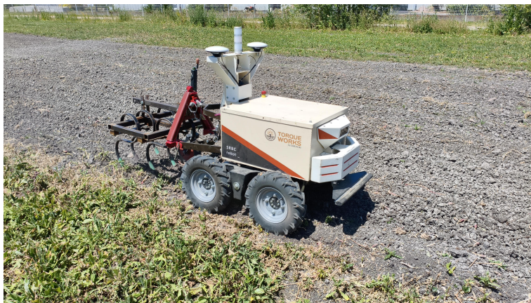
Figura 1.1: Foto di presentazione della missione