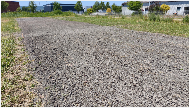
Prima del lavoro