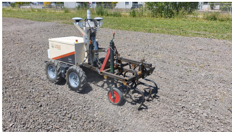
Figura 1.1: Foto di presentazione della missione