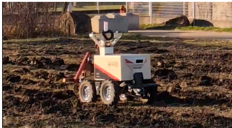
Figura 1.1: Foto di presentazione della missione