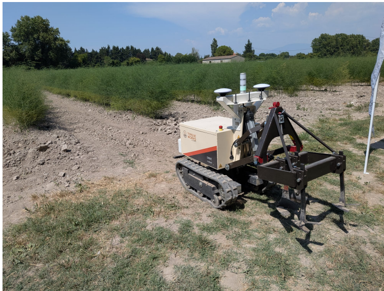
Figura 1.1: Foto di presentazione della missione