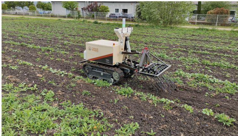
Figura 1.1: Foto di presentazione della missione