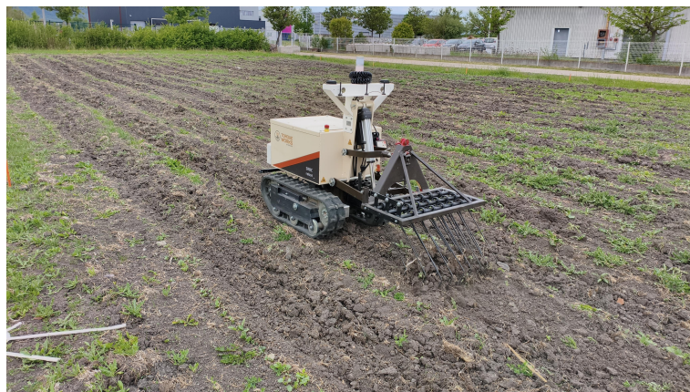
Figura 1.1: Foto di presentazione della missione