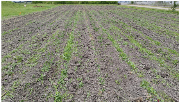
Prima del lavoro