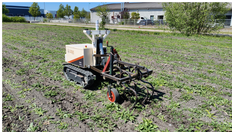
Figura 1.1: Foto di presentazione della missione