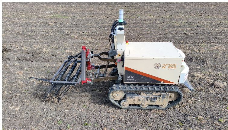
Figura 1.1: Foto di presentazione della missione