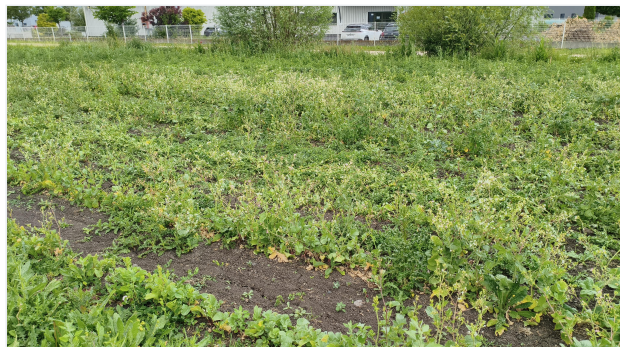
Antes del trabajo