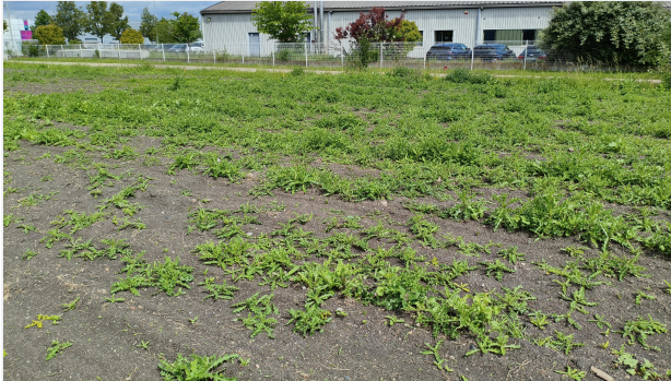
Antes del trabajo