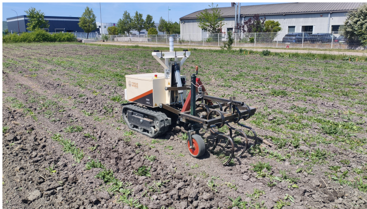
Figura 1.1: Foto de presentación de la misión