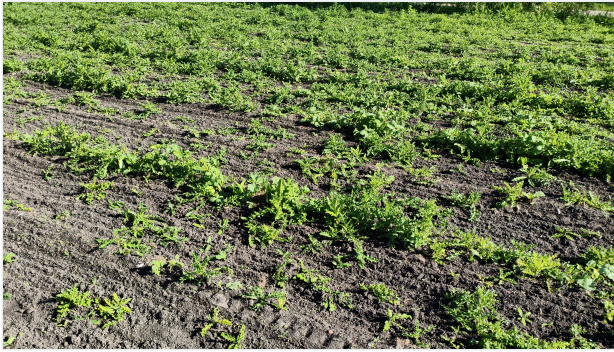
Vor der Arbeit