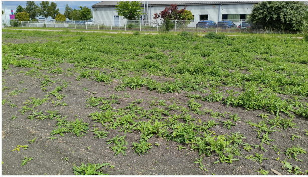
Vor der Arbeit