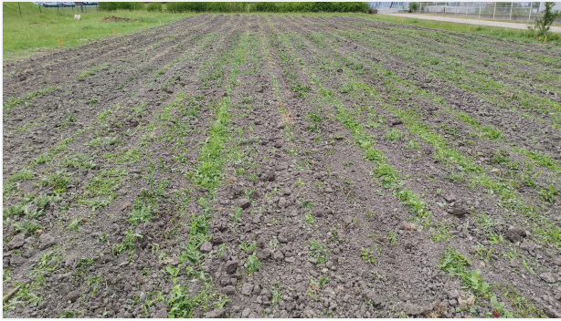
Vor der Arbeit